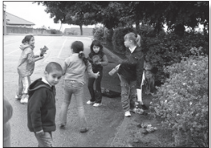
Activités jardinage au cycle 2