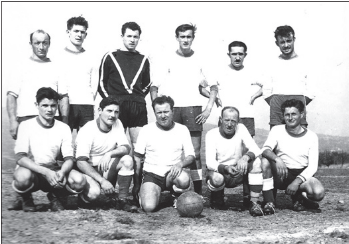
Une des premières équipes