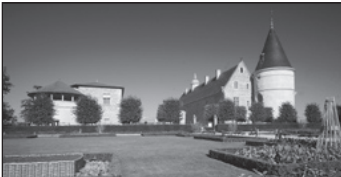
Sortie au château de Bouthéon