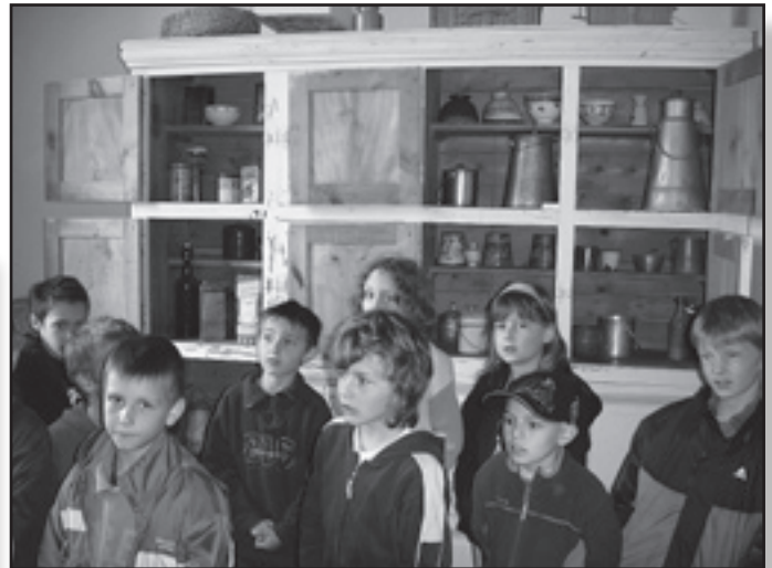
Visite du musée de l'école