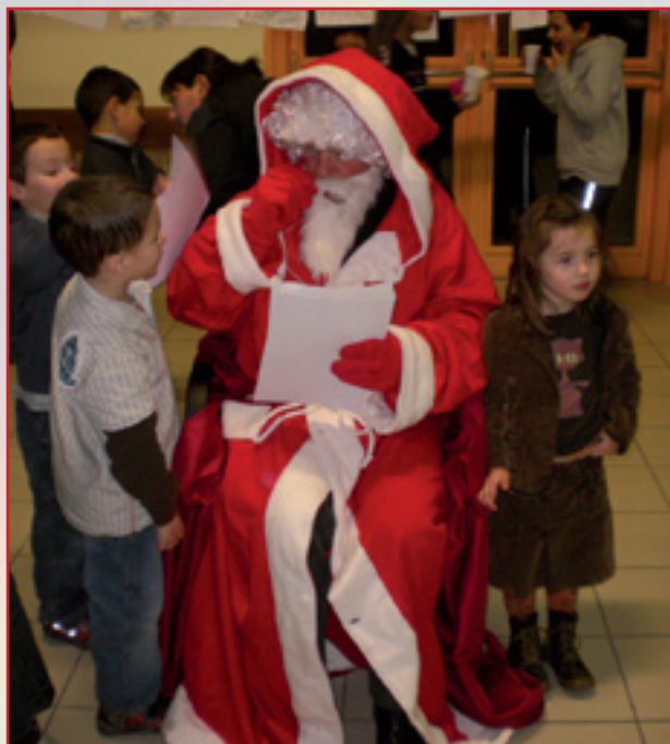
Le père Noël invité à la fête des commerçants

Le 8 décembre, les commerçants ont invité petits et grands au lancement des fêtes de fin d'année. Surprise, le père Noël était présent pour recevoir les dessins des enfants et tout le monde a partagé le verre de l'amitié.