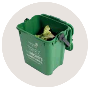
Un bio-seau (7 l) pour trier vos déchets alimentaires à domicile.

Saint-Étienne Métropole vous aide à valoriser vos déchets alimentaires pour enrichir les sols de votre jardin en fournissant gratuitement :