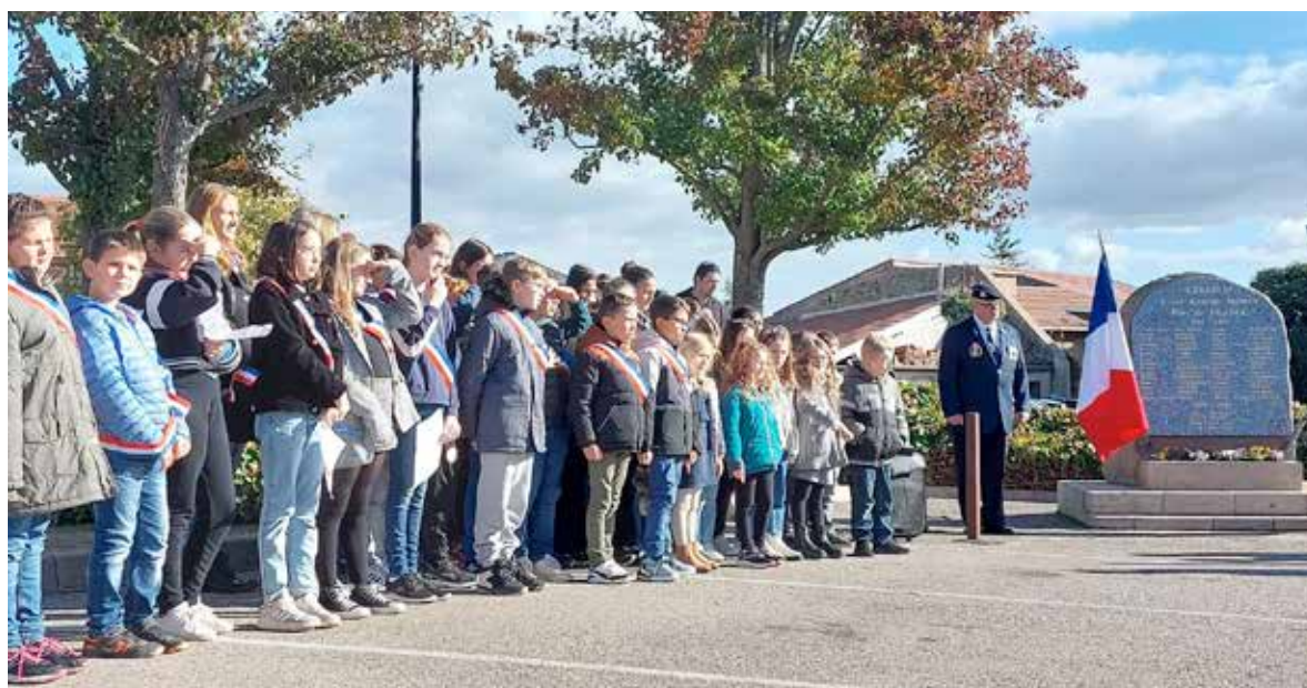
Commémoration du 11 novembre 2023