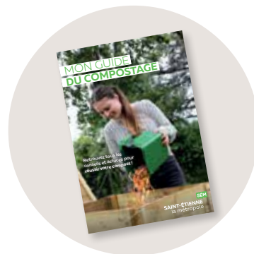
Un guide du compostage pour savoir comment bien composter (à retrouver aussi sur saint-etienne-metropole.fr ).