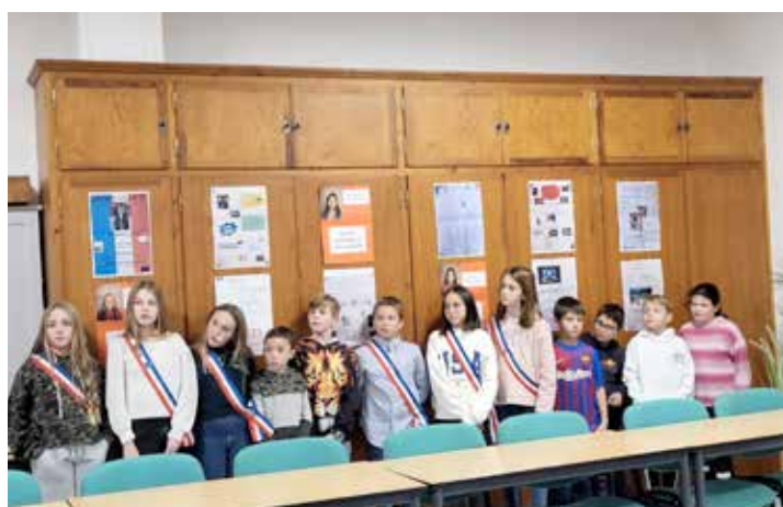
Installation du nouveau CMJ 04/12/2023