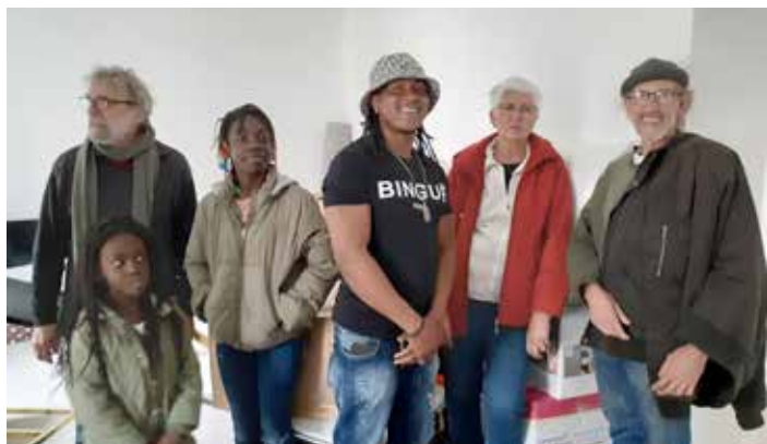
Des bénévoles de Jarez Solidarités aident une famille à déménager