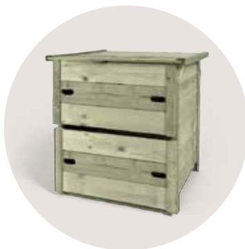
Un composteur (400 l) pour faire votre compost dans un coin de votre jardin.